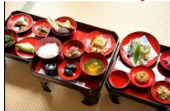
出羽三山 「精進料理」