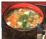
そば米雑炊・ひらら焼き